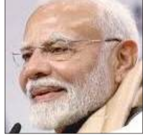
आने पर राज्य में घुसपैठियों द्वारा कब्जा जमीन को वापस करने के लिए कानून बनाएगी। इसके अलावा पार्टी ने 2.8 लाख सरकारी नौकरों और महिलाओं को हर माह 2,100 देने का ऐलान किया है। भाजपा ने इसके अलावा युवाओं को प्रोत्साहन राशि देने समेत कई वादे किए हैं। मोदी ने ‘एक्स’ पर एक पोस्ट में कहा,

नयी दिल्ली, (भाषा) प्रधानमंत्री नरेन्द्र मोदी ने झारखंड विधानसभा चुनाव के लिए रविवार को जारी भारतीय जनता पार्टी (भाजपा) के घोषणा पत्र को आदिवासी समाज के विकास और युवाओं को रोजगार के लिए प्रतिबद्ध तथा महिलाओं को सशक्त बनाने वाला बताया और कहा कि उनकी पार्टी राज्य में रोटी, बेटी और माटी की सुरक्षा के लिए प्रतिबद्ध है।