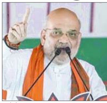
दायरे से बाहर रखा जाएगा।

रांची, (भाषा) केंद्रीय गृह मंत्री अमित शाह ने रविवार को झारखंड में झामुमो नीत सरकार पर “वोट बैंक की राजनीति के लिए बांग्लादेशी घुसपैठियों को संरक्षण देने” का आरोप लगाते हुए तीखा हमला किया और कहा कि यदि राज्य में उनकी पार्टी सत्ता में आई तो वह आदिवासियों की जमीन को अवैध प्रवासियों को हस्तांतरित होने से रोकने के लिए कड़ा कानून लाएगी।