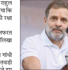
इस लड़ाई को जीतना चाहते हैं, तो आपको अपने दिल से गुस्सा हटाना होगा, नफरत हटानी होगी और इनकी जगह प्यार, विनम्रता और करुणा का भाव लाना होगा।

वायनाड, (भाषा) कांग्रेस नेता राहुल गांधी ने रविवार को इस बात पर जोर दिया कि आज देश में अहम लड़ाई संविधान की रक्षा और उसे संरक्षित करना है।