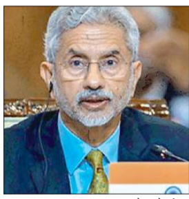
सलाहकार (एनएसए) और में दोनों अपने समकक्षों से मिलेंगे। तो चीजें इस तरह हुई हैं।”

ब्रिस्बेन, (भाषा) विदेश मंत्री एस जयशंकर ने रविवार को कहा कि भारत और चीन ने सैनिकों को पीछे हटाने की दिशा में “कुछ प्रगति” की है। उन्होंने इस घटनाक्रम को “स्वागत योग्य” कदम बताया।