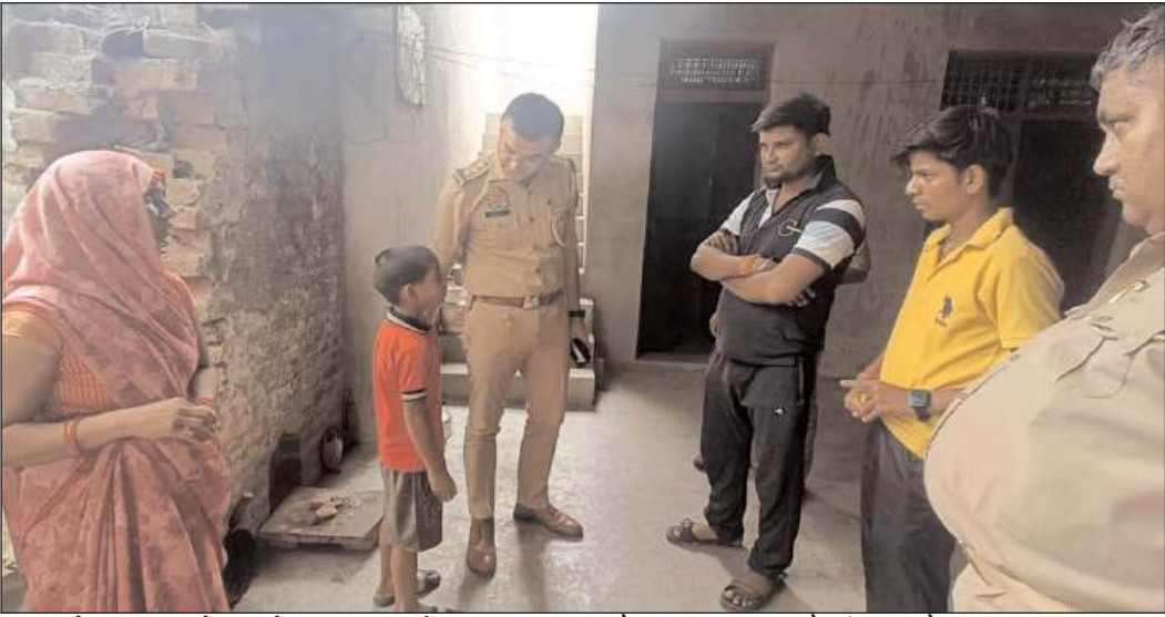
नेशनल एक्सप्रेस ब्यूरो।

शिकोहाबाद। जनपद के शिकोहाबाद थाना क्षेत्र के नगला ऊमर गांव में एक महिला और उसके पड़ोसी युवक की जहर खाने से मौत हो गई। गांव में दबी जुबान से चर्चा है कि मृतक महिला