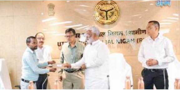
नेशनल एक्सप्रेस ब्यूरो

लखनऊ। जलशक्ति मंत्री स्वतंत्रदेव सिंह का अध्यक्षता में मंगलवार को उत्तर प्रदेश जल निगम (ग्रामीण) लखनऊ के सभागार में स्थानान्तरण नीति से आच्छादित लघु सिंचाई विभाग में कार्यरत अधिशासी अभियन्ता, सहायक अभियन्ता, अवर अभियन्ताओं के पारदर्शी प्रक्रिया के अंतर्गत स्थानान्तरण आदेश का वितरण किया गया। इस अवसर पर 07 अधिशासी अभियन्ताओं, 19