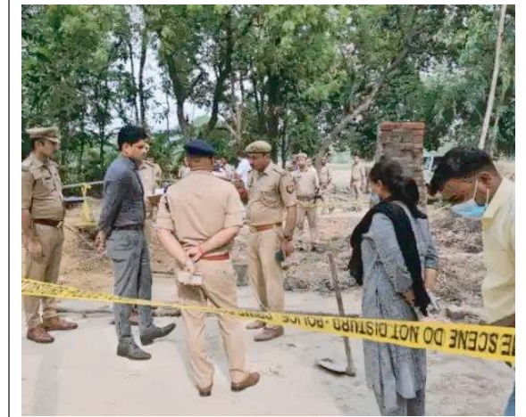
नेशनल एक्सप्रेस ब्यूरो

रायबरेली। खेत में काम कर रहे किसान की मंगलवार दिनदहाड़े फावड़े से काटकर हत्या कर दी गई। पुलिस ने शव को पोस्टमार्टम में भेजकर जांच शुरू कर दी है। तनाव की आशंका के मद्देनजर मौके पर भारी पुलिस बल को तैनाती की गई है।