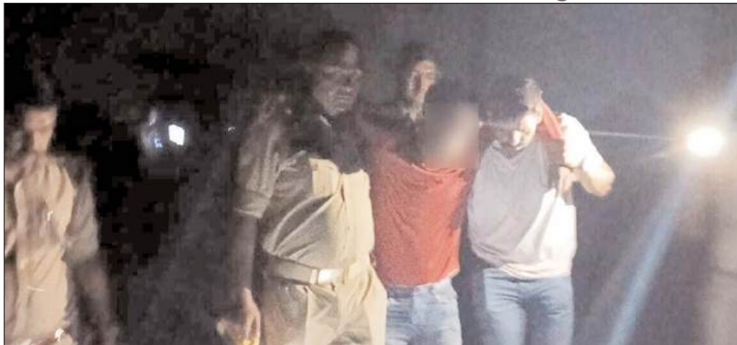
नेशनल एक्सप्रेस ब्यूरो।

माल बरामदगी के लिए जाने पर आरोपी ने किया पुलिस पर हमला