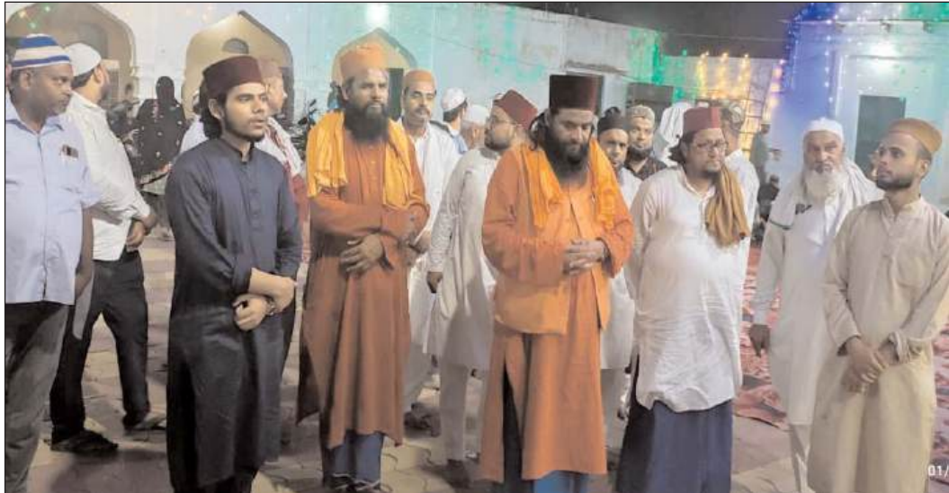
नेशनल एक्सप्रेस/ तहसील रिपोर्टर।

जसराना। कस्बा पाढ़म में मौजूद संदल शाह रहमतुल्ला अलैह की दरगाह पर तीन दिवसीय उर्स का आयोजन किया गया। उर्स के दौरान जायरीनों ने कब्बाली का लुप्त उठाया। कस्बा में मौजूद संदल शाह