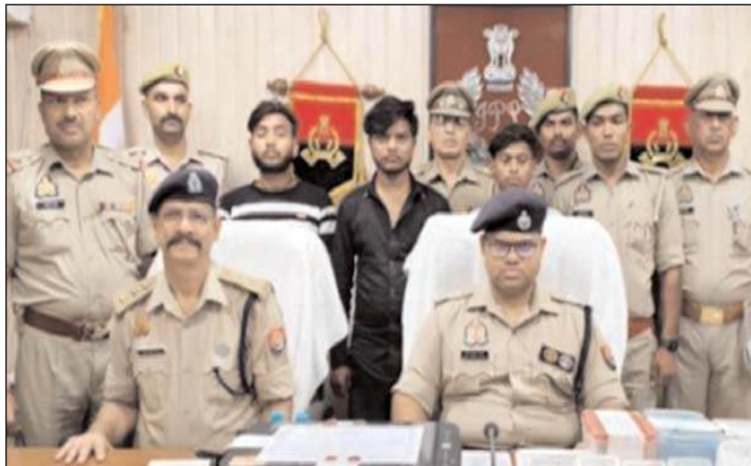
नेशनल एक्सप्रेस ब्यूरो