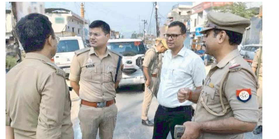
नेशनल एक्सप्रेस ब्यूरो