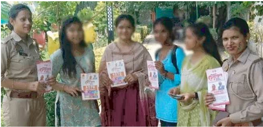
नेशनल एक्सप्रेस ब्यूरो

उल अजहा पर्व के परिप्रेक्ष्य में कानून एवं शांति व्यवस्था के दृष्टिगत थाना गलशहीद क्षेत्रान्तर्गत ईदगाह स्थल का भ्रमण,निरीक्षण कर सुरक्षा व्यवस्थाओं का जायजा लिया गया तथा संबंधित को आवश्यक दिशा-निर्देश दिये गये।