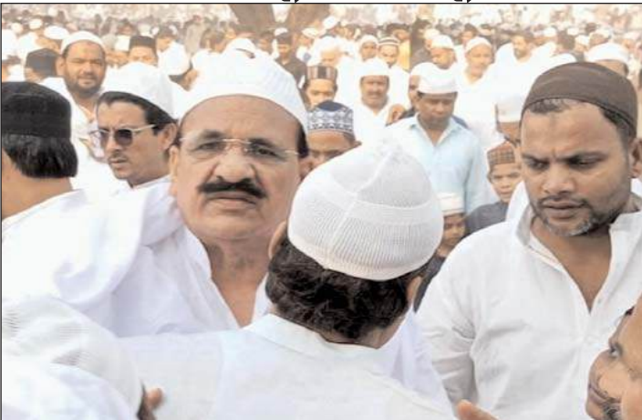
नेशनल एक्सप्रेस ब्यूरो

अमरोहा। ईद उल अजहा की नमाज शांति पूर्ण तरीके से अदा की गई। देश में अमन चैन की दुआ करने के उपरांत कुबानी की गई। शनिवार को ईद उल