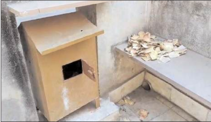
नेशनल एक्सप्रेस/क्राइम रिपोर्टर ।

फिरोजाबाद। जनपद के कोटला रोड स्थित नगला करन सिंह में काशी विश्वनाथ महादेव मंदिर में अज्ञात चोरों ने दानपात्र का ताला तोड़कर भारी नकदी चोरी कर ली। चोर रात में दानपात्र से 500, 200, 100 और 50 रुपये के नोट निकाल ले गए, जबकि 10-20 रुपये के नोट और सिक्के वहीं छोड़ दिए। मंदिर