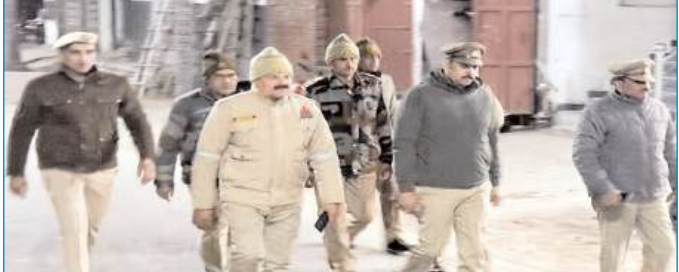
नेशनल एक्सप्रेस ब्यूरो

एवं सार्वजनिक स्थलों पर असामाजिक तत्वों पर विशेष नजर रखी गई।